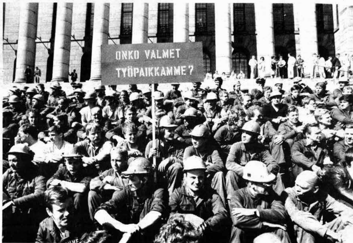
Valmetin ja Wärtsilän työläiset ovat vaatineet eduskuntaa estämään valtiojohtoisen telakateollisuuden teurastuksen ja tuhansien työpaikkojen hävittämisen.

Valmetin ja Wärtsilän työläiset ovat taistelleet voimakkaasti fuusiota vastaan työpaikkojen puolesta.