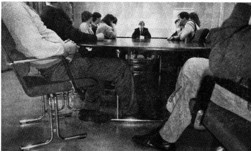
Osallistuminen Kuola-projektiin toisi Lappiin tuhansia pysyviä työpaikkoja.

On mielenkiintoista nähdä, mitä hallituspuolueet ja niiden konsensus-politiikalle tukensa antaneet oppositiovoimat lupavat työttömille nyt eduskuntavaalien alla. Näitä lupauksia kuunnellessaan työttömät voivat huuhkua "Pettäjän tietä". Herrojen suurilla sanoilla ei vuokria eikä ruokalaskuja makseta.