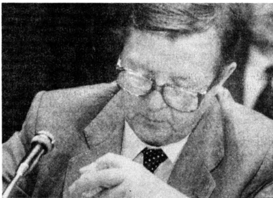
Pääministeri Kalevi Sorsa puhui suuria keväällä 1983. Tekoja lupauten täyttämiseksi saa hakea suurennuslasilla. Mikroskooppikin olisi hyviä tarpeeseen.