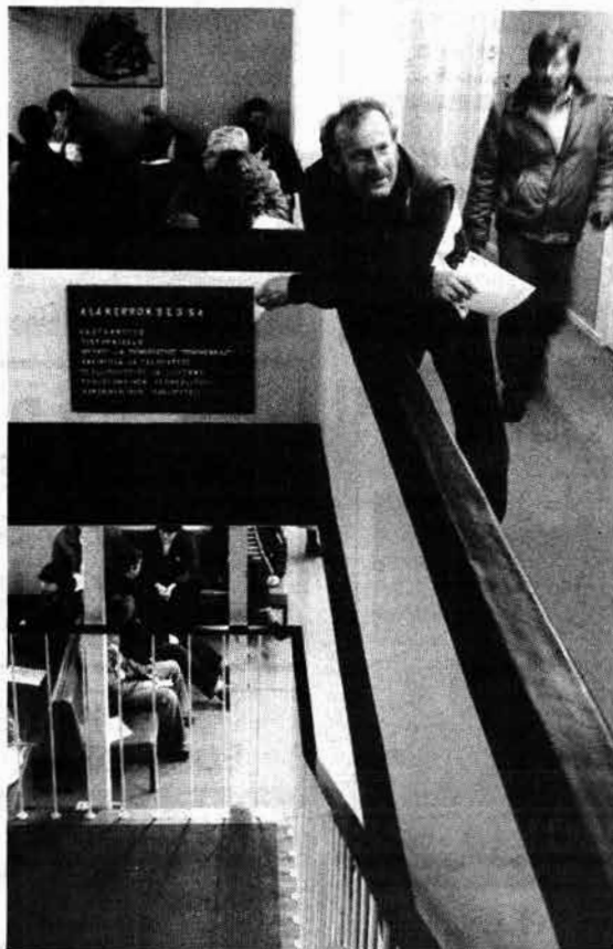
Suomalaisen lain ja järjestyksen mukaan työttömyys ei ole ihmiselle riittävä tuomio, hänestä on tehtävä vielä rikollinenkin.