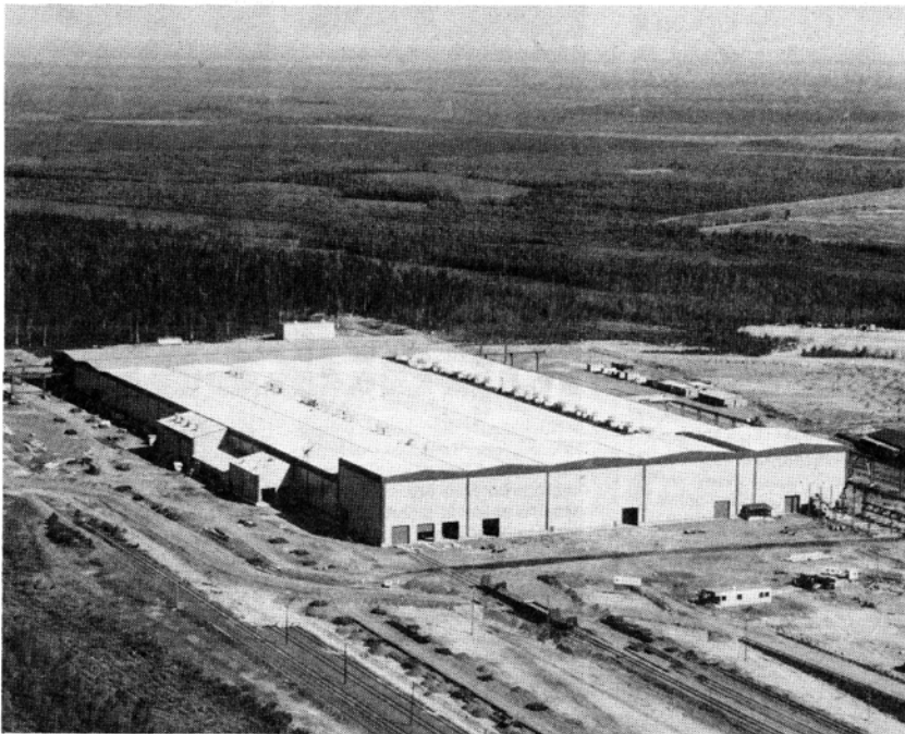
Suomen ja Neuvostoliiton välisen tuotannollisen yhteistyön kehittämiseen on rajattomat mahdollisuudet. Kuvamme on Otanmäestä, jossa Rautaruukki tekee yhdessä neuvostoliittolaisten kanssa erikoisjunavaujuja.