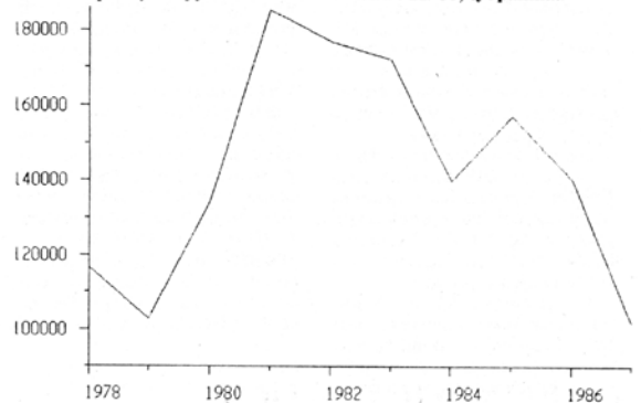
NL:n kaupan työllisyysvaikutus — Tiainen P. 11/86, työpaikkaa

Välittömässä vaikutuksessa otetaan huomioon työpaikat NL:oon toimituksia tekevässä tuotannossa ja tämän tuotannon ostot muilta. Kokonaisvaikutuksessa otetaan huomioon lisäksi välilliset kansantalouteen.