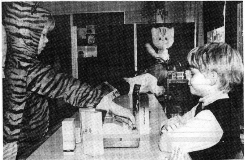
Työtä Suomessa riittää. Esimerkiksi kunnallisista päivähoitopaikoista on huutava puute.

Kodinkone Huolto M. MAJA Ky. Karjalant. 6 Karhula p. 610 08