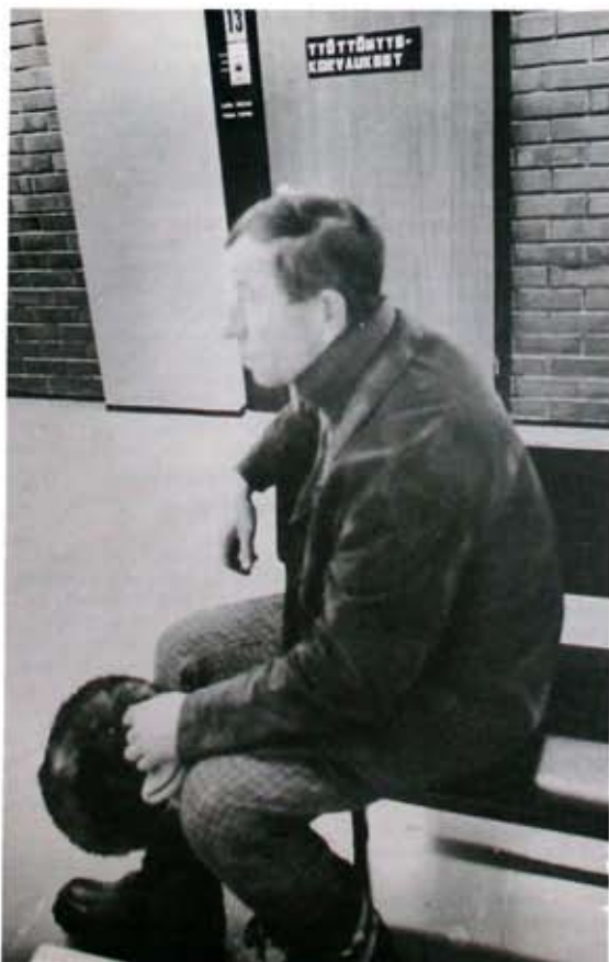
□ Hallituksen budjettiesitys kohtelee erityisen kovakouraisesti 55 vuotta täyttäneitä työttömiä.

Samanaikaisesti tehtiin kui-tenkin kaksi "pehmenystä". 55 vuotta täyttäneen työttö-myysturvaa parannettiin. Kun