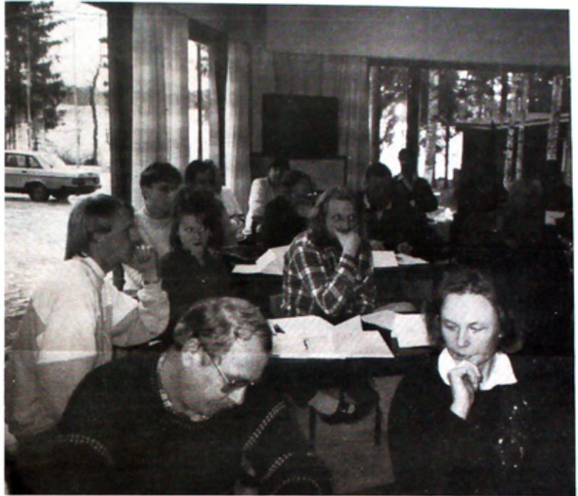
□ Kuvassa Vaherman seminaarin osallistujia. Vakavat asiat vetivät myös ilmeet vakaviksi.

Työttömien Valtakunnallisen Yhteistoimintajärjestön loppiaisenä pidettyyn seminaariin ja kokoukseen osallistui väkeä yli kahdeltakymmeneltä paikkakunnalta. Kauniin luonnon keskellä sijaitsevassa Vaherman kurssikeskuksessa vietetyt kaksi päivää olivat sisällöllisesti antoisia. Kokoustamisen ja tulevan toiminnan suunnittelun lomassa jäi sopivasti aikaa myös saunoamiseen ja yhdessäoloon.