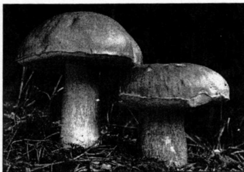
Tämä on herkkutatti. Tartu tattiin ja luuriin, kartuta käteiskassaasi sievoisilla lisäansiolla ja virkisty metsäisessä luonnossa.