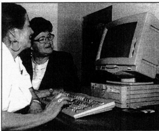
Mikko Mikko tuli. Töitä odotellessa sillä on hyvä kirjoitella hallitukselle muistutuksia työllistämislupauksista.

Valitettavasti nurmekselaiset eivät hoksanneet vaatia työpaikkoja, sillä "luvatun mikä luvattu". Olisi vammaan kelvannut vaikka eduskunnasta SDP:n kautta kiertätty työpaikkakin. Mutta onhan hallitusohjelmassa vähän isompikin lupaus. Sen perään kannattaa kysellä isommallakin porukalla äänellä.