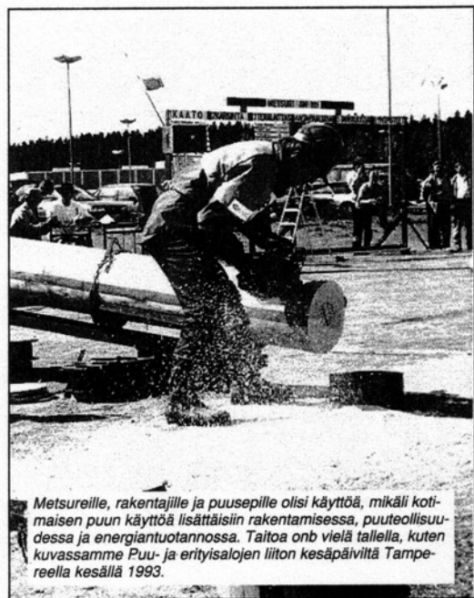
Metsureille, rakentajille ja puusepille olisi käyttöä, mikäli koti-maisen puun käyttöä lisättäisiin rakentamisessa, puuteollisuu-dessa ja energiantuotannossa. Taitoa on vielä tallella, kuten kuvassamme Puu- ja erityisalojen liiton kesäpäiviltä Tampe-reella kesällä 1993.