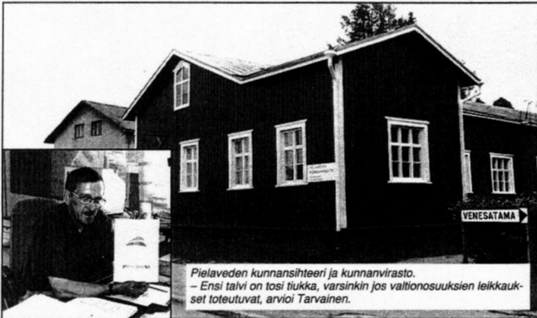
Pielaveden kunnansihteeri ja kunnanvirasto. - Ensi talvi on tosi tiukka, varsinkin jos valtionosuksien leikkaukset toteutuvat, arvioi Tarvainen.