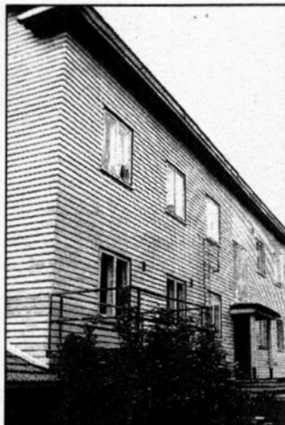
Tästä entisestä virkamiestalosta työttömien yhdistys saa uudet toimintatilat.

-Marjonniemen leirikeskukseen siivomitse tulkotilla. Siihenkin piti