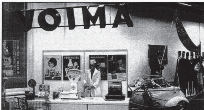
Oi niitä aikoja, kun edistysmielinen osuuskuppaliike oli vielä voimissaan. Onneksi näin on Työväen keskusmuseossa syyskuun loppuun saakka.

Vai mitä sanoo Rengas-kahvi, Solifer-mopo, kolmipyöräinen Messerschmitt, palveluymälöiden pakkaukset, Betlesit ja hipit sekä karuhkot tehtaan työssä käyvän poikamiehen boksit, ahtaat keittiöt ja Jopo-polkupyörät. Kun tietoneen ruudulta voi vielä poimia 60-luvun uutisia ja nurkassa seisoo jukeboxi, on nostalgia täydellinen.