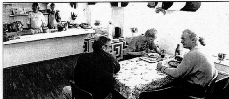
Kuvassa Rantakievarin "ensimmäisen vaiheen" avajaiset keväällä 1994. Nyt on toimitilaa kaksi kerrosta lisää ja ruokala sijaitsee ensimmäisessä kerroksessa.