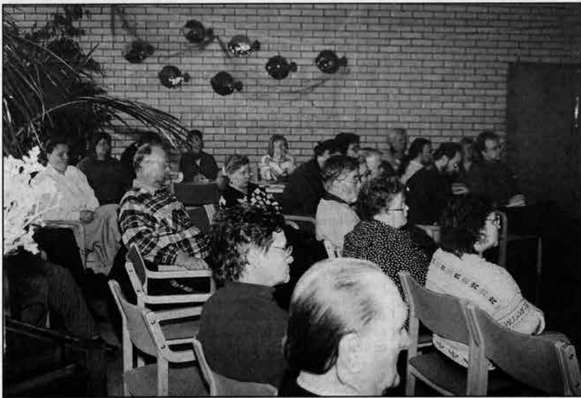
Noin 60 työntöntä, muuta kansalaisaktiivia ja kirkon työntekijää kokoontui Kangasalan Ilkossa. Päävaatimus päättäjille oli työttömyyden ja nälän ottaminen tosissaan ja siitä seuraavat poliittiset päätökset ja teot.

Kangasalan Ilkon kurssi-keskuksessa huhtikuussa kokoontuneet pirkanmaalaiset työttömät, muiden kansalaisjärjestöjen aktiivit ja heidän kanssaan työskentelevät kirkon työntekijät vetoavat Suomen hallitukseen, että se katsoisi yhteiskuntaa myös työttömien ja pienituloisten näkökulmasta.