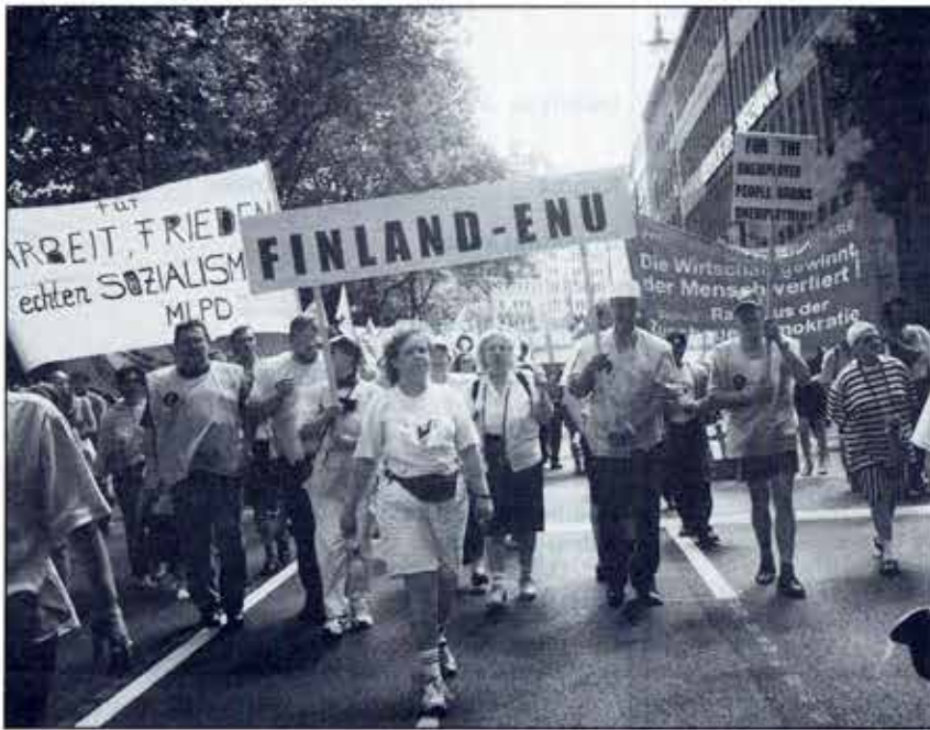
Työttömien Eurooppalaisen marssin päätapahtumassa Kölnissä oli Suomesta noin 40 hengen joukko kertomassa tervetse EU:n päättäjille. Suomalaisen päätunnus oli "oikeaa työtä oikealla palkalla". Kotimaassa viestit kulkevat pohjoisesta etelään saakka. Matkan varrella kerättiin nimiä työllisyystunnuksen puolesta.

Työttömien Eurooppalaisen marssin Suomen osuus lähti liikkeelle 3. toukokuuta neljältä paikkakunnalta eli Rovaniemeltä, Oulusta, Vaasasta ja Kuhmosta.