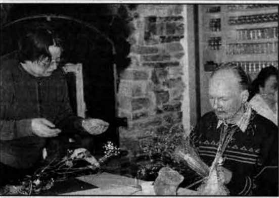
Juankosken työttömien yhdistyksen kurssilla valmistettiin mm. Elämänpuu-töitä. Oman elämän haaveet ja pettymykset käytiin läpi.

Joidenkin kurssilaisten antautumisen tekemisilleen oli niin intensiivistä, että ajan käsite unohtui ja teosta olisi voinut jatkaa loputtomiin. Se motivoikin antamaan näyttelylle nimeksi Riittäkö yksi