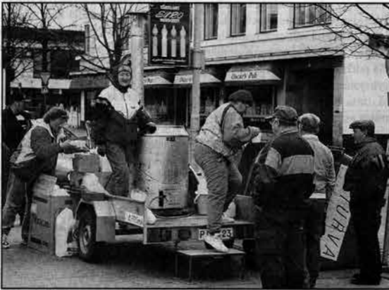
Työttömien hernesoppa maistui vappuna Varkauden torilla. Työttömät olivat muuttenkin mukana vappujuhlassa. Uudet toimitilat on myös yksi kevään ilonaihe. Toiminta uudessa paikassa käynnistyi vapun jälkeen.

Varkauden seudun työttömät ry on saanut uudet toimitilat, jotka sijaitsevat Kuoppakankaalla Latukatu 14:ssä Varkauden kaupungin vuokraamissa tiloissa. Yhdistys järjestää toimitiloissa säännöllisen päivystyksen. Toimitilojen pinta-ala on noin 150 neliometriä. Toiminta uusissa tiloissa käynnistyi heti vapun jälkeen.