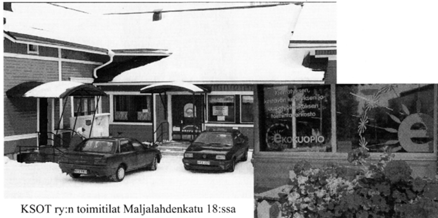
KSOT ry:n toimitilat Maljalahdenkatu 18:ssa