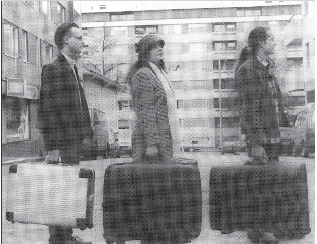
Typillinen Eurooppaan lähtijä on kielitaitoinen nuori.

Ruotsin ja Norjan avoimet työpaikat näkyvät suoraan työvoimatoimistojen ATK-päätteillä, mutta muissa Eta-maissa euroneuvoja on yhdessä työnantajan kanssa valinnut työpaikat, jotka näkyvät suoraan Suomen työvoimatoimistojen Eures-järjestelmässä. Parhaiten kohdemaan työpaikoista saa tietoa paikan päällä työnvälityksestä.