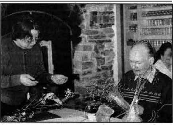
Juankosken työttömien yhdistyksen kurssilla valmistettiin mm. Elämänpuu-töitä. Oman elämän haaveet ja pettymykset käytiin läpi.

Joidenkin kurssilaisten antautuminen tekemisilleen oli niin intensiivistä, että ajan käsite unohtui ja teosta olisi voinut jatkaa loputtomiin. Se motivoikin antamaan näyttelylle nimeksi Riittääkö yksi elämä.