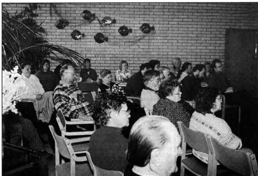
Noin 60 työntöntä, muuta kansalaisaktivia ja kirkon työntekijää kokoontui Kangasalan Ilkossa. Päävartimus päättäjille oli työttömyyden ja nälän ottaminen tosissaan ja siitä seuraavat poliittiset päätökset ja teot.

Kangasalan Ilkon kurssikeskussa huhtikuussa kokoontuneet pirkanmaalaiset työttömät, muiden kansalaisjärjestöjen aktiivit ja heidän kanssaan työskentelevät kirkon työntekijät vetoavat Suomen hallitukseen, että se katsoisi yhteiskuntaa myös työttömien ja pienituloisten näkökulmasta.