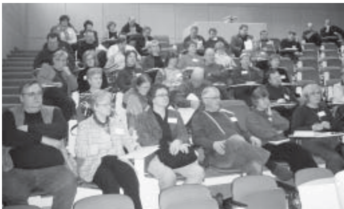
Päivien osallistujia. Kuvassa Seurakuntien, hiippakuntien, TVY ry:n yhdistysten ja Tatsi ry:n porukkaa.