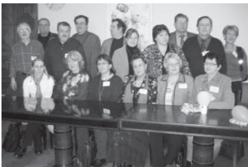
TVY ry:n hallitus v. 2006