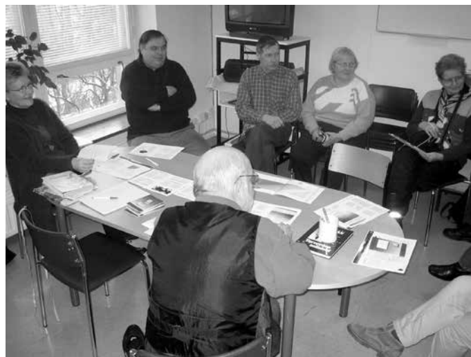
Kyllä se siitä s. 8