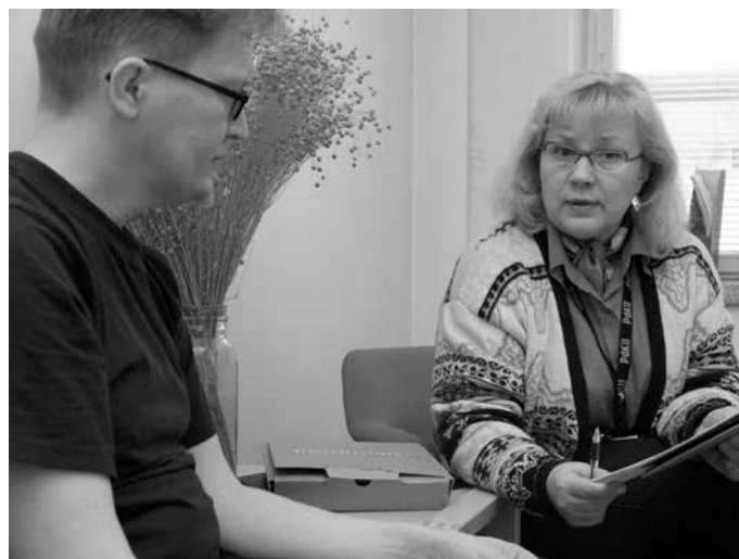
Luotsi - projekti s. 16