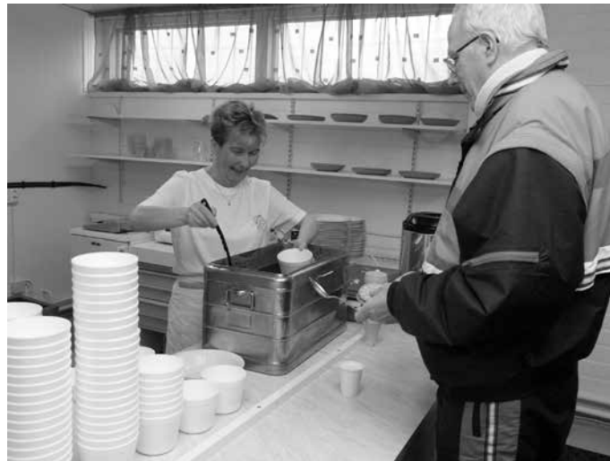
Rieskaruokala s. 10