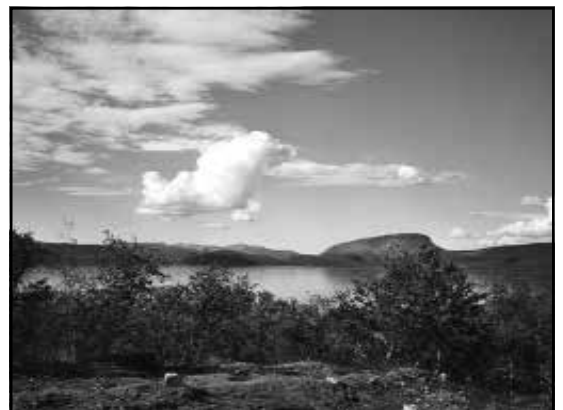
Saanatunturi Lapin yöttömässä yössä s. 24