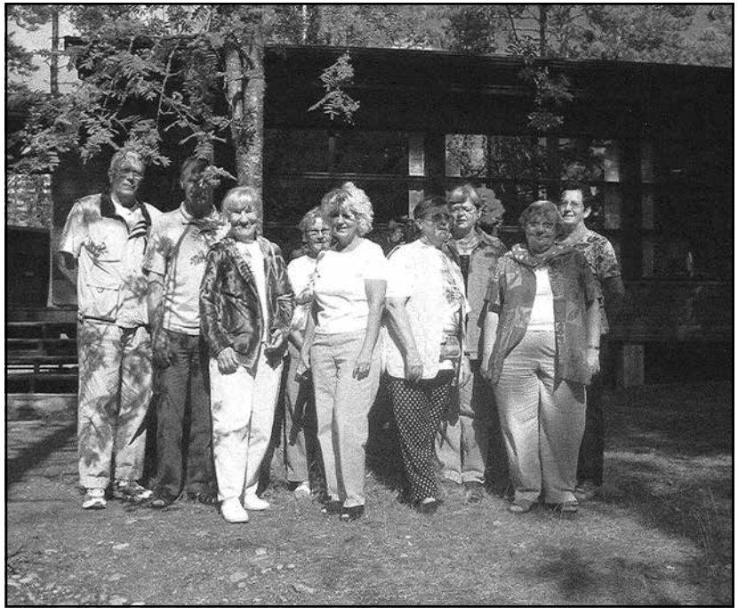
Retken toisena päivänä ryhmämme kävi mm. ruokailemassa Onnenkallion seurakuntakeskuksessa.

PS. Muodosta oma Köpö-ryhmä! Ota yhteyttä toimintakeskuksen