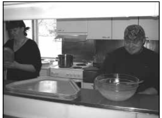
Katsaus TST:n sivuruokaloihin s. 14-15