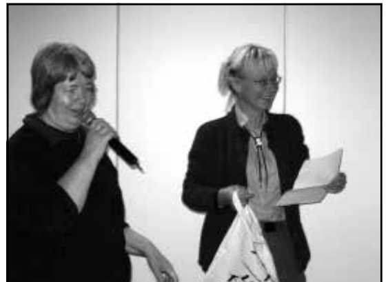
Suu messingillä karibiaristeilyllä s. 20