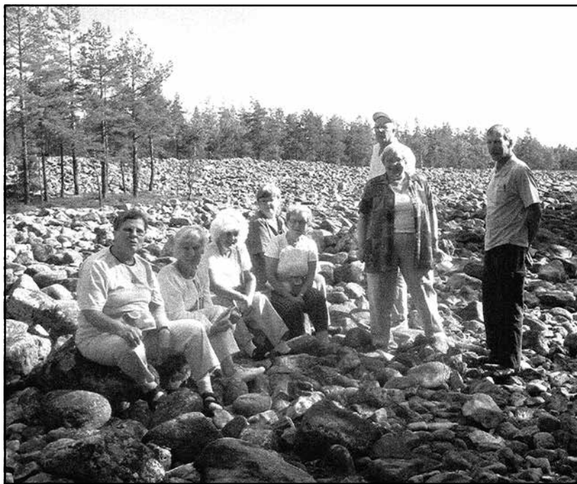
Ensimmäisenä retkipäivänä 16. elokuuta Köpö-Maha -ryhmä vie-raili Lauhavuoren kivijätällä.