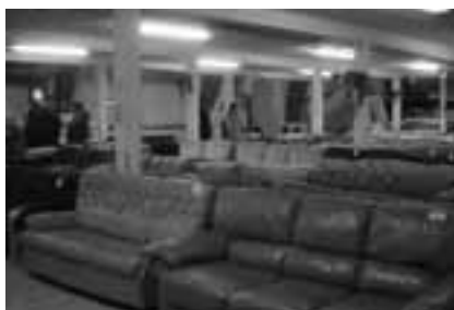
Suurhalli on täynnä huonekaluja, kodinkoneita ja kirppistavaraa. Sähkö- ja elektroniikkalaitteita voi tuoda kierrätykseen veloitusetta