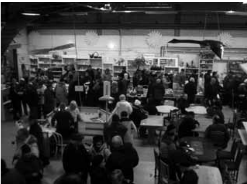
Avajaisissa kävi tuhansia ihmisiä.

Turun Ekotori aloitti toimintansa 1998. Toiminnasta vastaa TST Kestävän kehityksen yhdistys Ry. Ekotorilla on kolme toimipistettä eri puolilla kaupunkia. Yhteistyökumppaneina ovat muun muassa Ely-keskus, Turun kaupunki, TE-toimisto ja Turun Ekopaja. Toiminta-ajatuksena on yhdistää työllistäminen ja käytännön ympäristönsuojelutyö. Kierrätystavaran lisäksi myös hyöty- ja ongelmajätteitä saa tuoda Ekotorin vastaanottopisteisiin. Turun Ekotori työllistää vuosittain yli 100 henkilöä. Ekotorilla on oma pyöräpaja, pesukonehuolto, TV-korjaamo ja ATK-verstas, joissa kunnostetaan kierrätykseen tulevia tavaroita. Ekotori tarjoaa kierrätys- ja jäteneuvontaa sekä ympäristövalistusta ryhmille ja yksittäisille asiakkaille.