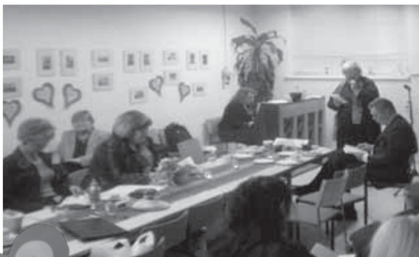
Tunnelmalliseen ystävänpäiväiltaan osallistui lähes 20 TST:n jäsentä.