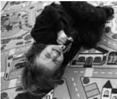
7 Akkuna jäsenille