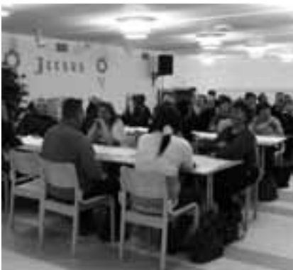
Yhdistys muutti huhtikuussa 2009 uusiin helluntaiseurakunnalta saattuihin tiloihin.