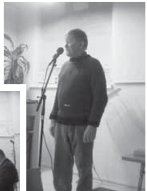
Esa Rantanen lausui kirjoittamiaan runoja, muun muassa Hinkuyskän.