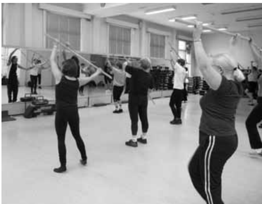
Keppijumppa avaa niskan ja hartiat.