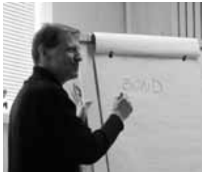
10 Tiainen puhui lamasta