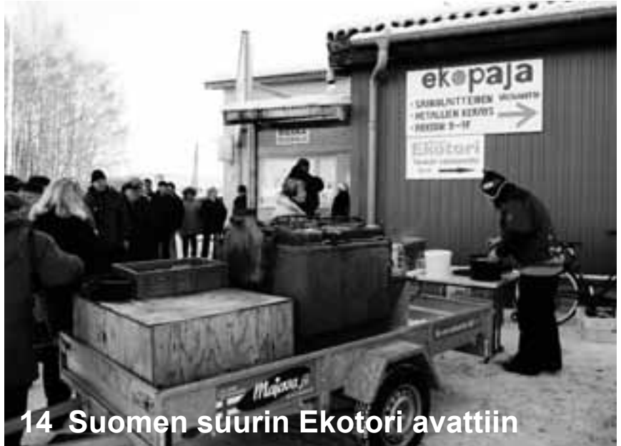
14 Suomen suurin Ekotori avattiin