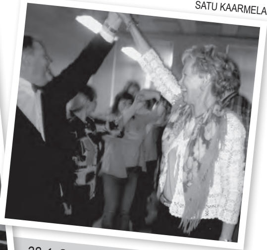
28.4. Slaavilaisen illan venäläistä tunnelmaa.