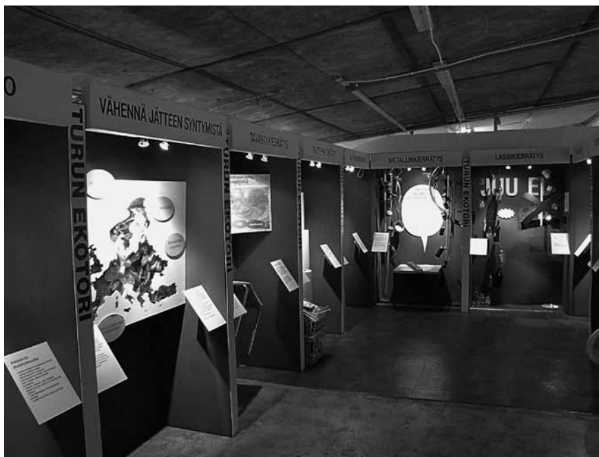
Kirkkotien Ekotorilta löytyy hauskoja tapoja tutustua kierrätykseen ja sen hyötyihin niin, että jopa perheen pienimmät jaksavat keskittyä.