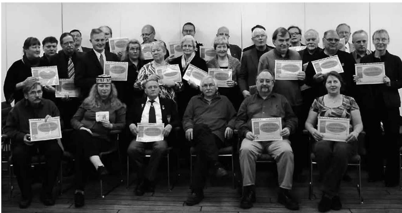
Kurssien ja kerhojen ohjaajat saivat diplomit.