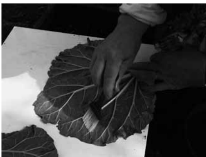
Raparperinlehti kannattaa voidella ruokaöljyllä ennen kuin sille laittaa sementtiä.