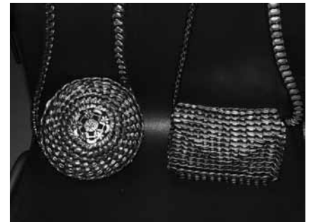
Juomatölkinnipsuista valmistetut upeat laukut vaativat tekijältään taitoa ja kärsivällisyyttä.