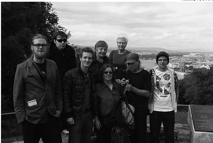
Kulttuuriryhmän matkalaiset Budapestissa