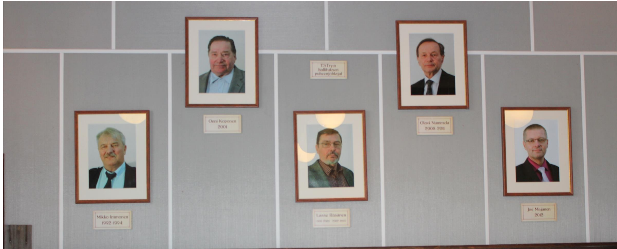
Turun Seudun TST ry:n puheenjohtajia (Kanslerintiellä)