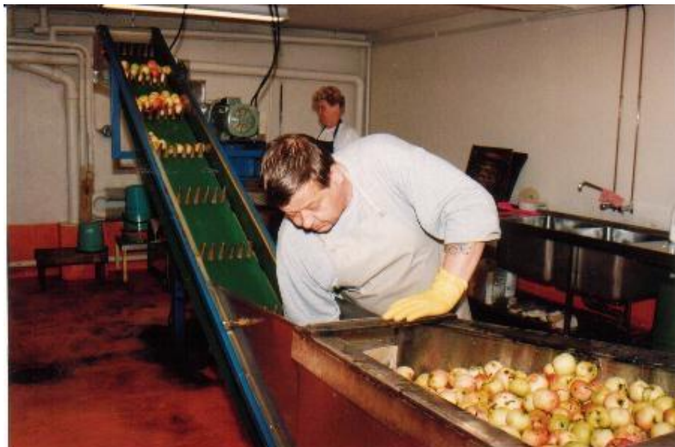
Porin Seudun Työttömien tuoremehuasema